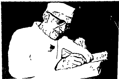
Signing the Constitution (Song 43)